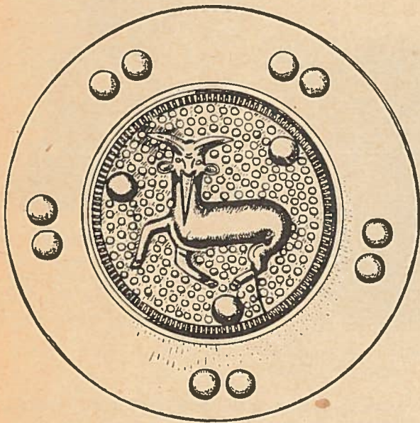
Abb. 7. Zierplatte aus Silber, vergoldet. Fredsoe, Jütland. National-Museum Kopenhagen. Zeichn. Hans Drescher. 3./4. Jahrh. n. Chr. Nat. Gr.

wahrte Zierscheibe aus Fredsoe, Mors, Jütland, gehört auch zu dieser Fundgruppe, nur mit dem Unterschied, daß es sich nicht um eine Fibel handelt, sondern es ist offensichtlich der Beschlag des Ortbandes von einer Schwertscheide. Die Zierscheibe und die Randfassung aus Silber waren mit Nieten auf organischem Stoff, jedenfalls auf Holz, befestigt (Abb. 7). Das dargestellte Tier, offensichtlich ein Bock, ist mit dem Kopf und dem Vorderteil gezeigt, während das Hinterteil in Seitenansicht dargestellt ist. Dementsprechend hat das Tier zwei Vorderläufe.