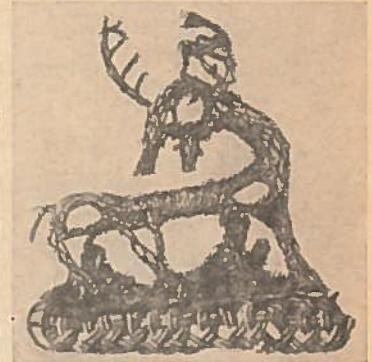
Abb. 8. Hirsch aus Golddraht auf Seidenstoff gestickt. Aus den Wikingerfunden von Birka, Schweden. 10. bis 11. Jahrh. n. Chr. (Nach Agnes Geyjer)

lichen Pokale mit menschlichen Masken und Tierdarstellungen aus Himlingöie (Dänemark) gehören in diesen Kunstkreis.