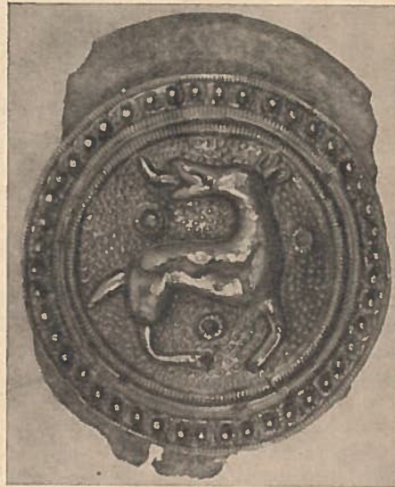
Abb. 1. Scheibenfibel aus Tangendorf mit Zierplatte aus vergoldetem Silber. Nat. Gr. 3./4. Jahrh.

Im Jahre 1938 rückte die Fundstelle, die den Flurnamen „Im schwarzen Dorn“ trägt, in den Blickpunkt des Interesses, als die Autobahn Hamburg—Hannover durch dieses Geländestück gelegt wurde. Die Dammschüttung durchschnitt ein großes bronzezeitliches Gräberfeld, dessen Grabhügel sich bis in die Feldmark Brackel fortsetzen.