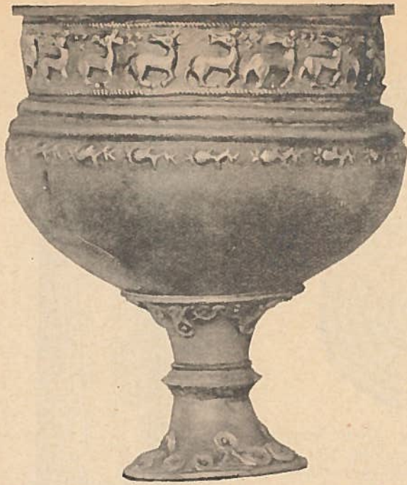
Abb. 4. Silberpokal aus Nordrup, Dänemark. 3./4. Jahrh. n. Chr. \frac{3}{4} nat. Gr. Nach J. Werner