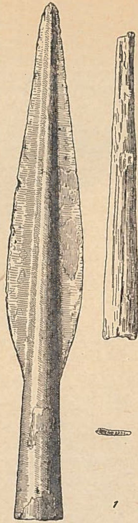
Abb. 3. Lanzenspitze aus Bronze mit Resten des Holzschafes und einem Holznagel. Jüngere Bronzezeit, 1000 - 800 v. Chr. Tangendorf, Hügelgrab 48. \frac{1}{2} nat. Gr.

Wenn wir unter den Funden des 3. und 4. Jahr-