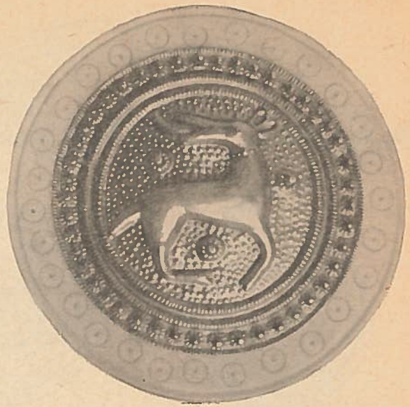
Abb. 5. Nachbildung der Scheibenfibel aus Tangendorf. Nat. Gr.