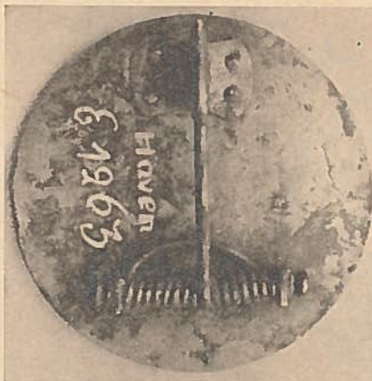
Abb. 6. Die Scheibenfibel aus Häven in Mecklenburg. Vorder- und Rückseite. 3./4. Jahrh. n. Chr. Nat. Gr.