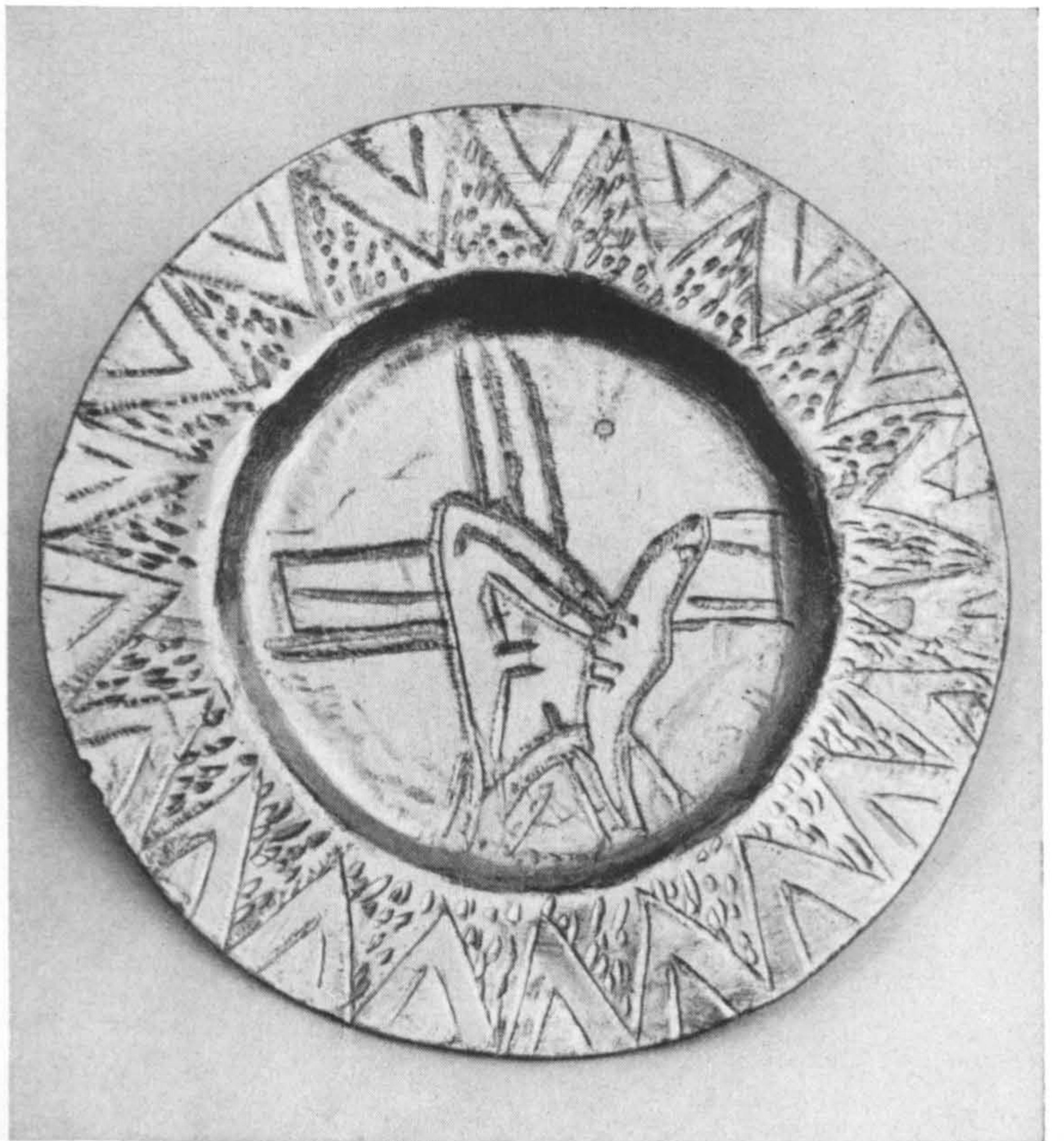
1 Zeitz, Domklausur. Grabkelch, im Maßstab 2:1. 2 Zeitz. Patene zum Grabkelch, im Maßstab 2:1.