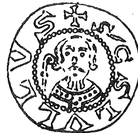
Karls- oder Lulluspennig, von dem bei den Grabungen (1897) in der Fuldaer Michaelskirche 16 Exemplare gefunden wurden. Die Abbildungen zeigen die Vorder- und die Rückseite.

spätere reichsfürstliche Stellung des Abtes angebahnt. Das Kloster Hersfeld galt daraufhin als „abbatia regalis“, als Reichsabtei.