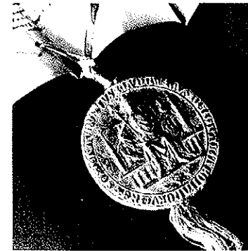
Siegel Kaiser Ludwigs des Bayern aus dem Jahre 1314 (Original, Wachs) Durchmesser 10 cm