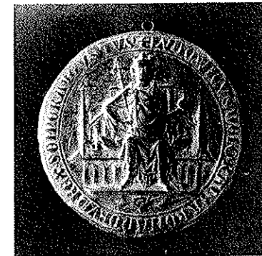
Wachsabguß von obigem Kaisersiegel