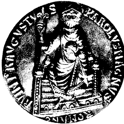
Großes Siegel der Stadt Aachen, um 1150 (stark verkleinert)