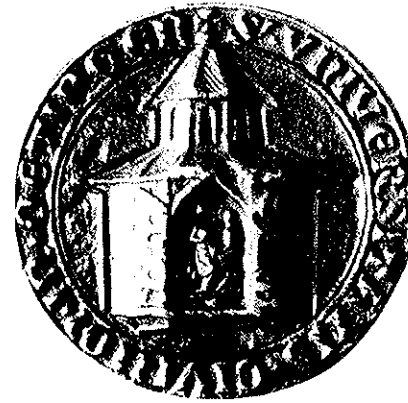
Ältestes Siegel der Stadt Neutötting, Anf. 14. Jh. Durchmesser 6 cm