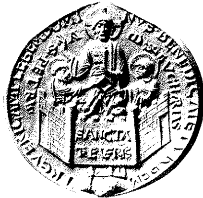
Ältestes Siegel der Stadt Trier. Nachschnitt von 1537 des ältesten Typars um 1113 (stark verkleinert)