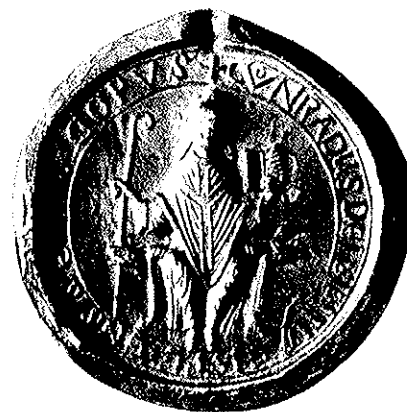
Porträtsiegel des Bischofs Konrad von Eichstätt, 1156 Durchmesser 7,6 cm