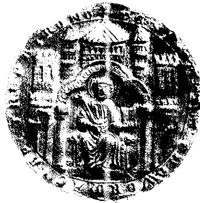
Ältestes Stadtsiegel von Worms, um 1185 (verkleinert)