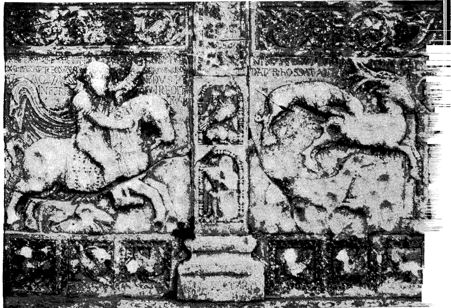
Kathedrale San Zeno in Verona: Hirschjagd (Dietrichs Höllenritt)

Auf der linken Platte erblicken wir einen von links nach rechts galoppierenden Reiter, hornblasend und mit wild flatterndem Mantel. Er folgt (auf der rechten Platte dargestellt) einem fliehenden Hirsch. Zwei dem Reiter vorausseilende Hunde haben den Hirsch schon eingeholt, und der eine der beiden Hunde hat sich bereits in den Rücken seines Opfers verbissen. Der Hirsch springt auf ein am rechten Rand des Reliefs sich befindendes schmales rundbogiges Portal zu: seine Vorderläufe ragen bereits über die linke der das Portal begrenzenden Säulen in die Türöffnung, in der — und das ist nun das Besondere an dieser Darstellung — eine dem Hirsch (und dem diesem folgenden Reiter) entgegensehende Gestalt steht: der gehörnte Teufel, der den Reiter offensichtlich erwartet.