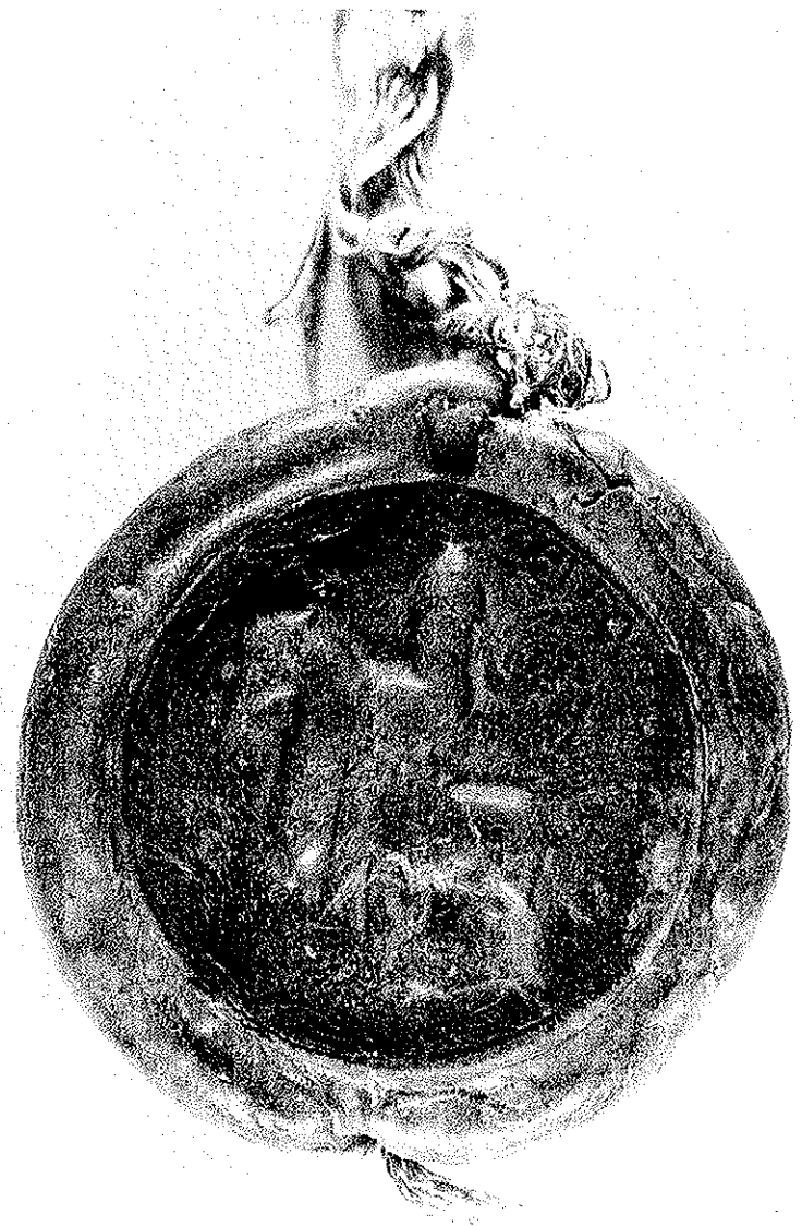
Siegel Herzog Welfs VI. an der Urkunde Friedrichs I. für Kreuzfahrer, Konstanz 1154 (Nähschmieg). — Th. Ab. II, 38