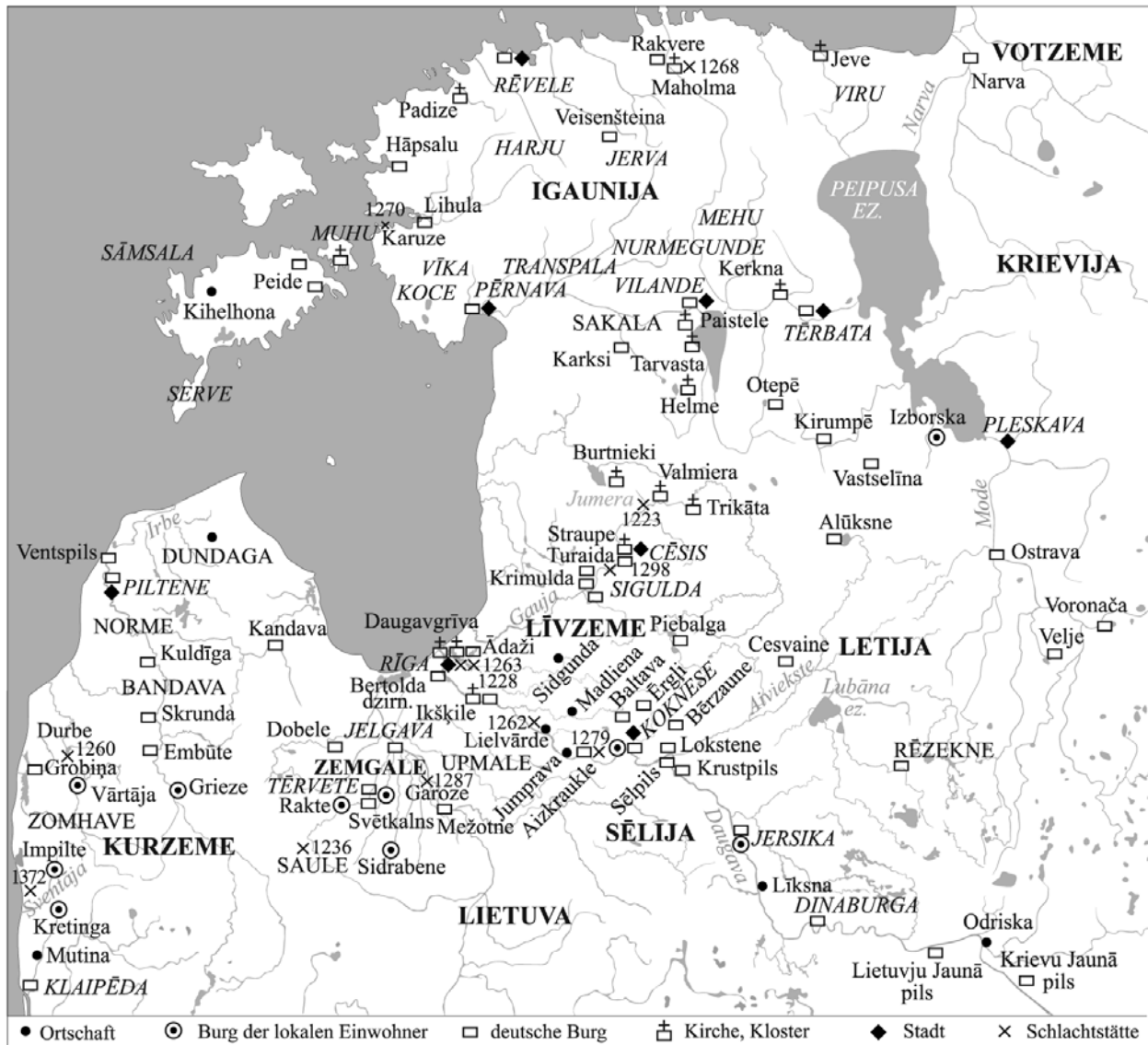
Karte 1 – Die Länder, Burgen, Kirchen, Dörfer, Flüsse, Seen, Schlachtstätten im Livland und in den Nachbarländern (Mugurēvičs, 2005, Abb. 4).

1 žemėlapis. Šalys, pils, bažnyčios, kaimai, upės, ežerai, mūšių vietos Livonijoje ir gretimose žemėse