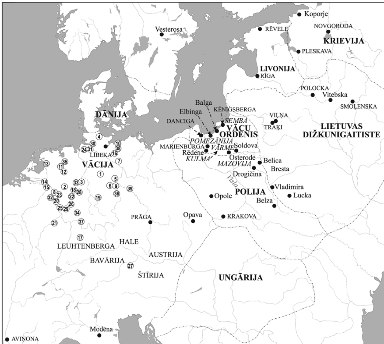
Karte 2 – Die Länder, Staaten, Städte u.a. Ortschaften im Europa (Mugurēvičs, 2005, Abb. 1).

1 – Šteinberga, 2 – Fitinghofa, 3 – Arnsberga, 4 – Dersove, 5 – Dreilēbene, 6 – Hornhauzene, 7 – Dannenberga, 8 – Dinklage, 9 – Heimburga, 10 – Rambova, 11 – Dipenbroka, 12 – Frilingshauzene, 13 – Hohenhorsta, 14 – Loena, 15 – Floveriha, 16 – Šverīne, 17 – Feihtvangene, 18 – Manderne, 19 – Hacigenšteina (Hatšteina), 20 – Bahema, 21 – Tizenhauzene, 22 – Nordeke, 23 – Frimersheima, 24 – Nindorfa, 25 – Zaina, 26 – Zalca, 27 – Felbene, 28 – Varburga (Vartberge), 29 – Grīningene, 30 – Hāzeldorfa, 31 – Jorke, 32 – Monheima, 33 – Herike, 34 – Kacenellenbogene, 35 – Hārene, 36 – Hinneberge, 37 – Licelburga, 38 – Raceburga, 39 – Meisene