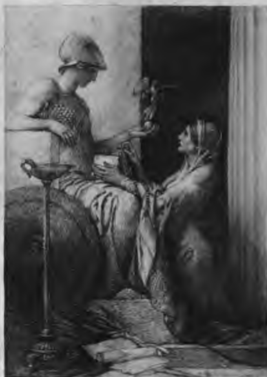
LELAND STANFORD JUNIOR UNIVERSITY