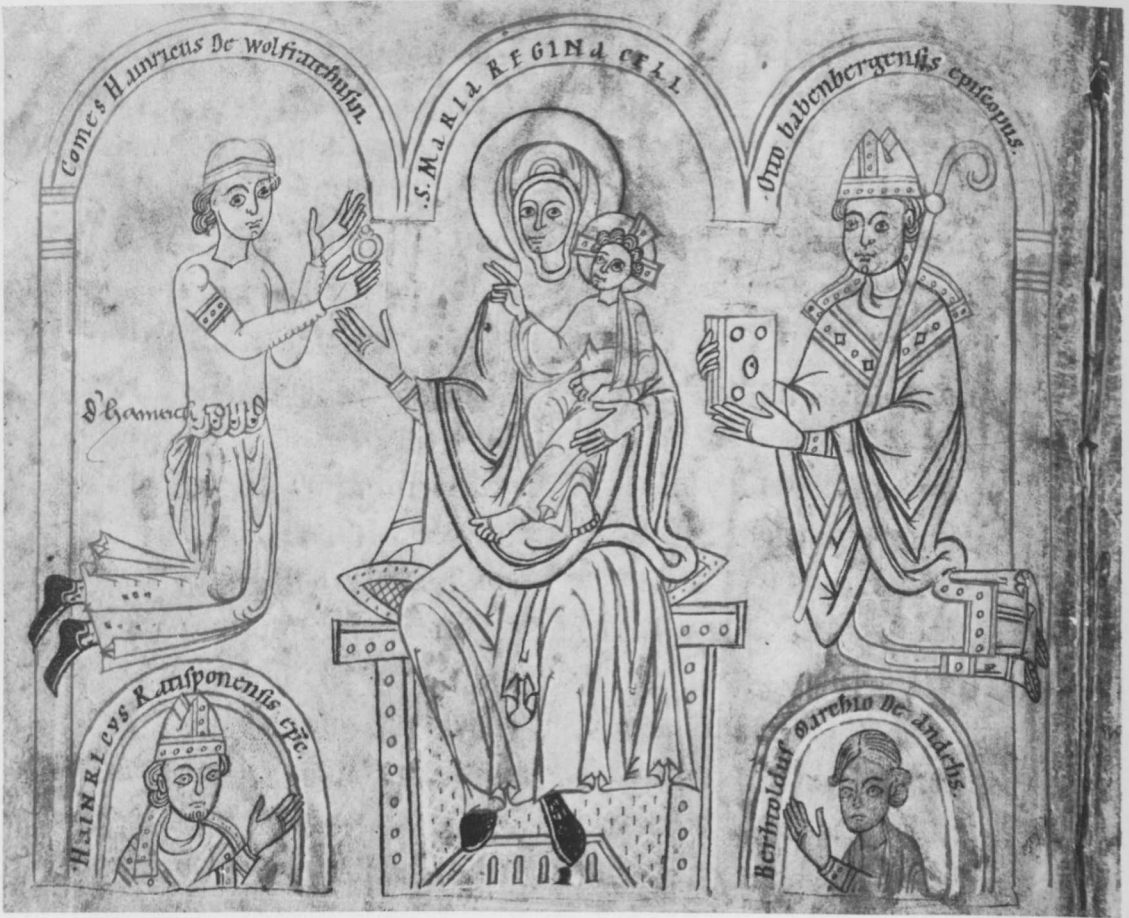
Abb. 4 Stifterbild aus dem Traditionscodex von Diessen (Bayerische Staatsbibliothek München, clm 1018, f. 35 v ).