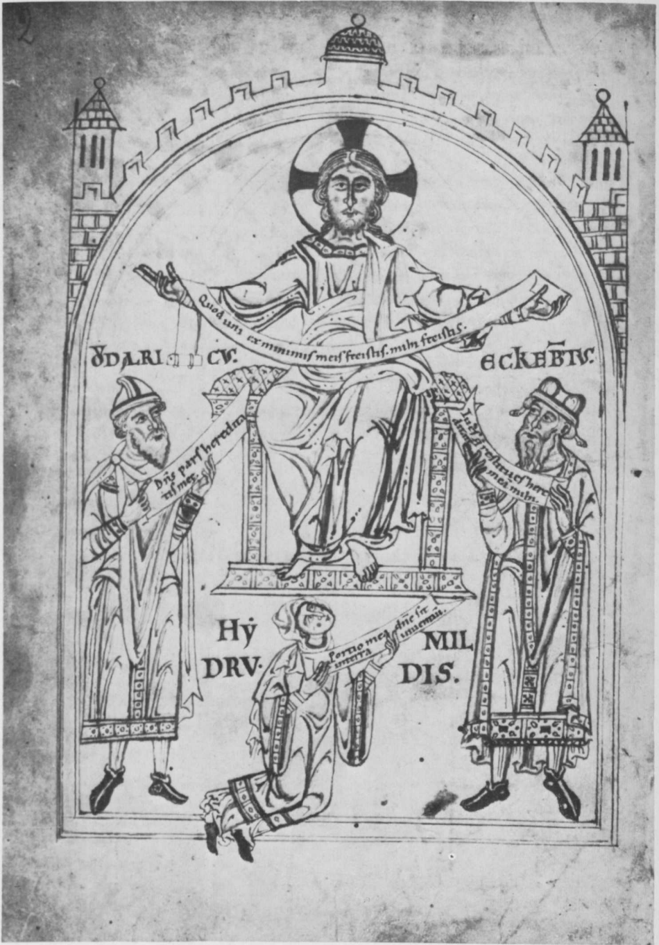
Abb. 2 Stifterbild im Formbacher Traditionsbuch (Bayer. Hauptstaatsarchiv, Kl.-Lit. Formbach, Nr. 1, S. 2).